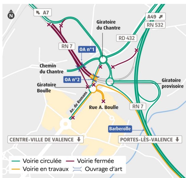
Étape 8 actuelle